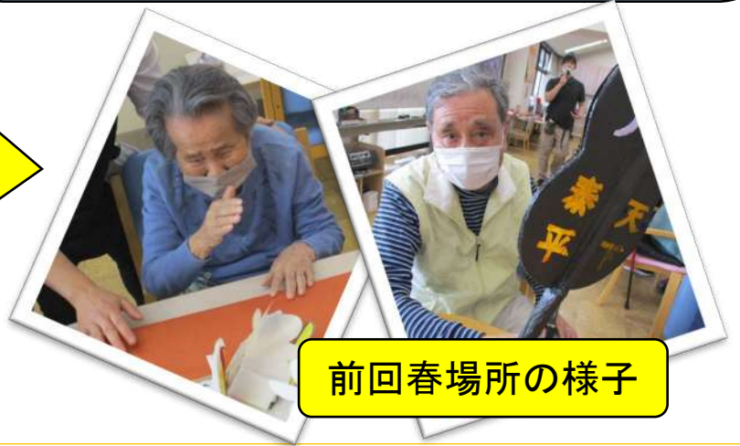
前回春場所の様子