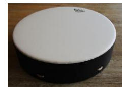
バッファロードラム

トーンチャイム は、アルミ合金製のパイプをたたいて共鳴させることで音を奏でます。一人一人が自分の音を担当し、皆で音楽を創り上げていきます。一人では演奏できない楽器のため演奏者は一体感を味わうことができます。また聴く人へは、柔らかく心に染み入るような美しく音色に安らぎと癒しを与えてくれます。 ツリーチャイム は、長さ数センチから十数センチの金属棒を数十本、半音ずつ横に並べて糸で吊り下げたもので金属棒を揺らすことで音が鳴ります。手で触れるだけでキラキラとした流れ星のような繊細な音が鳴るため、手を動かせる方であれば演奏を楽しめます。 バッファロードラム は、世界最古と言われているフレームドラムの種類の一つである片面太鼓で、打面は様々な動物の皮で作られており、音の響きに違いが出ます。