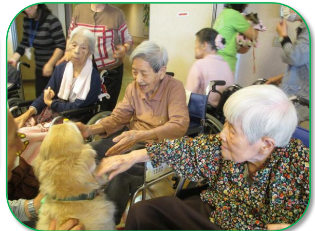
「かわいいねえ」の声と手があちらこちら から…人気犬は忙しい?!