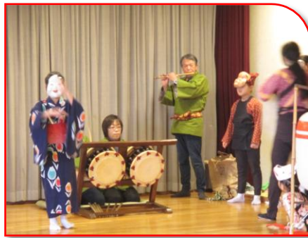
乞田囃子連によるお囃子です