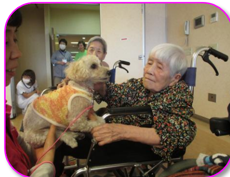
「おそわれるう〜」ってどっちが??