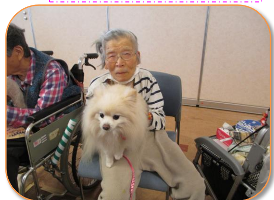
「写真撮ってえ〜」と二人?で「ハイポーズ!!」