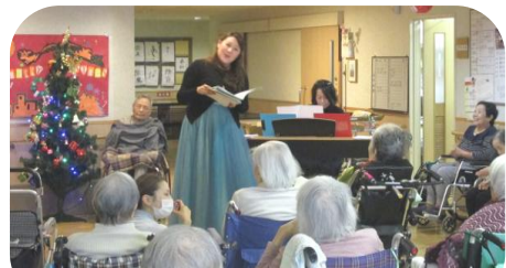
ホーム喫茶&クリスマス会 7F ご家族(娘様ピアノ演奏とお孫様のオペラのセッション)より素敵なクリスマスソングのプレゼント