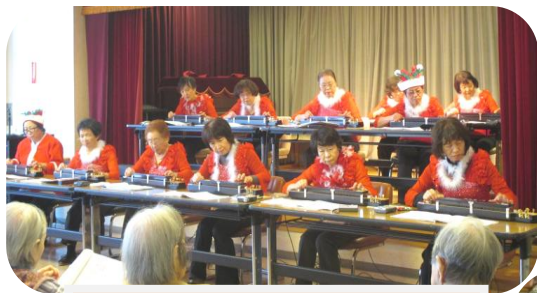
5F ご家族様所属の「まま琴会」による大正琴の演奏会