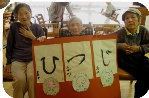
今年の年男・年女は 12 名 いらっやいます。