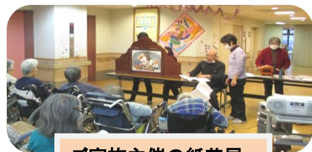
ご家族主催の紙芝居