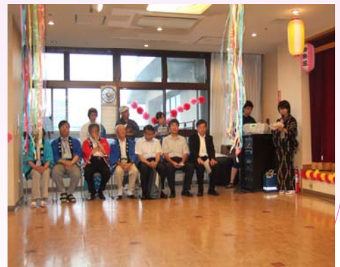
来賓の方々ご来荘有難うございました