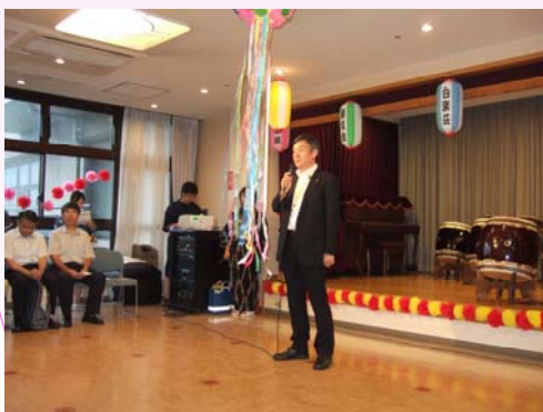
多摩市長にご挨拶いただきました