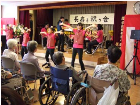
ベルブ・ブラス・バンドによる演奏