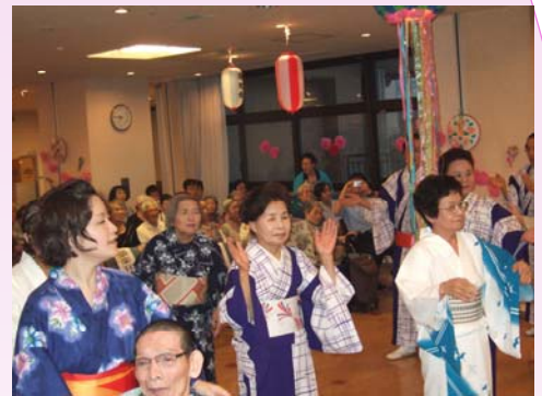
利用者様も参加した盆踊り