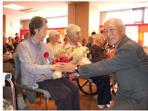
米寿の方の花束贈呈