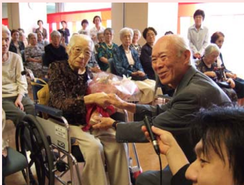
90歳以上の方の花束贈呈

9月12日(日)「長寿を祝う会」を開催しました。式典では、白楽荘と偕楽荘のご利用者様で、90歳以上の方(60名)、88歳・米寿の方(4名)に花束の贈呈が行われ、多摩市長、理事長より祝辞をいただきました。続いて長年にわたり当施設に御尽力いただいているボランティアの方々の表彰式を行いました。式典の後、ベルブ・ブラス・バンド吹奏楽団による演奏会が行われ、多くのご家族と共に長寿をお祝いすることができました。