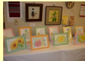
展示場所：3F フロアー

今年も偕楽荘の文化祭を行います。日ごろのクラブ活動の作品や個人作品など1年間の成果を展示いたします。たくさんのご来場をお待ちしています。