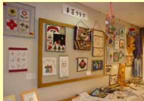
昨年の作品展示の様子