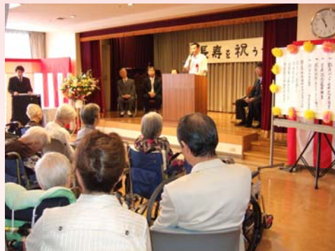
多摩市長によるお祝いの言葉