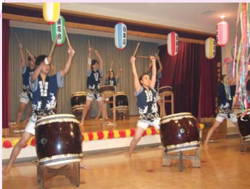
迫力のある恒例の愛宕太鼓