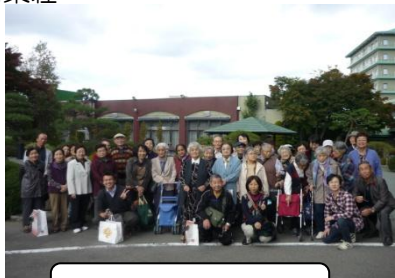
ホテル鐘山苑にて

偕楽荘→東名高速道路→秩父宮記念公園→ ホテル鐘山苑（昼食）→久保田一竹美術館 →偕楽荘