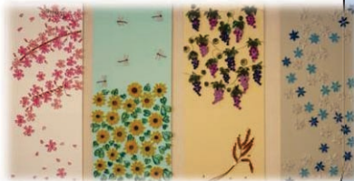
共同作品：パ・パ・クリツク