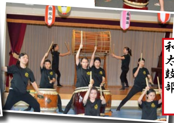
松が谷高校 和太鼓部