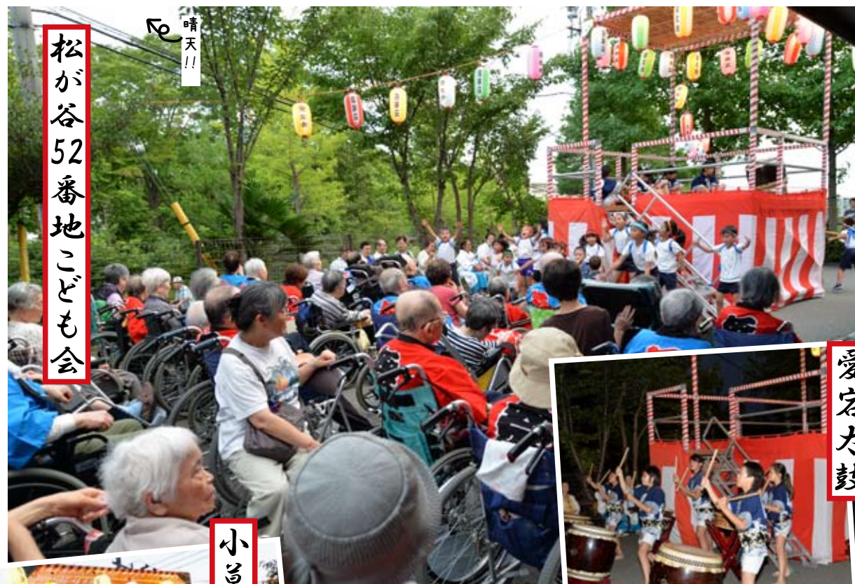
松が谷52番地こども会