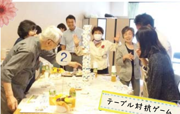
テーブル対抗ゲーム

テーブル対抗ゲームでは、6つのテーブルが、2センチの紙の輪を積み上げる高さを競いました。初対面の方たちも団結し、楽しいひと時となりました。その後ビンゴ大会で盛り上がり、お菓子を召し上がっていただきました。ボランティアの方々の交流の場としてもお楽しみいただけたかと思います。ご多忙の中、多くの方にご参加いただき、ありがとうございました。また、残念ながら当日ご参加いただけなかったボランティアの皆様にも、感謝を申し上げます。