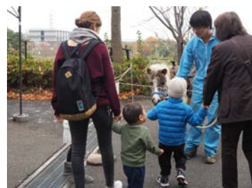
※写真は昨年度の楽友祭の写真です