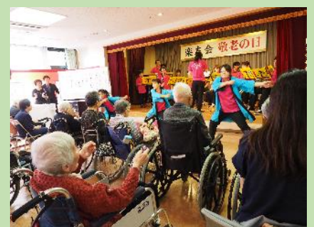
ベルブ・プラス・バンドによる演