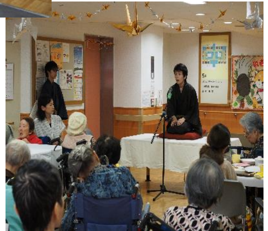
東京農大の学生による落語

水戸黄門様と助さん、おりんが各フロアを練り歩き、悪党を退治し、白楽荘の平和と皆様の健康をお祈りしました。