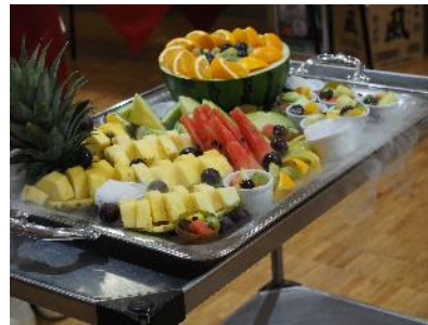
デザート・フルーツバイキング