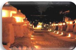
米沢の上杉雪灯籠祭り