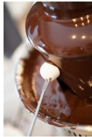
チョコレートファウンテン